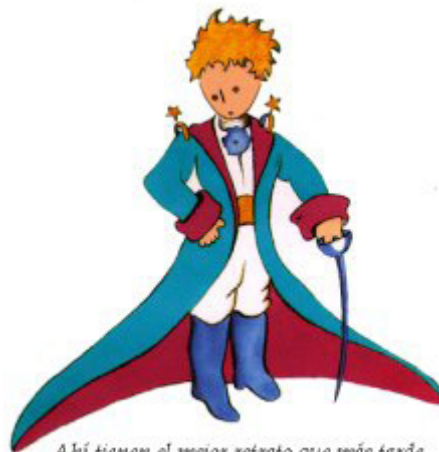
Aquí tienen el mejor retrato que más tarde logré hacer de él

Me puse en pie de un salto como herido por el rayo. Me froté los ojos. Miré a mi alrededor. Vi a un extraordinario muchachito que me miraba gravemente. Ahí tienen el mejor retrato que más tarde logré hacer de él, aunque mi dibujo, ciertamente es menos encantador que el modelo. Pero no es mía la culpa. Las personas mayores me desanimaron de mi carrera de pintor a la edad de seis años y no había aprendido a dibujar otra cosa que boas cerradas y boas abiertas.